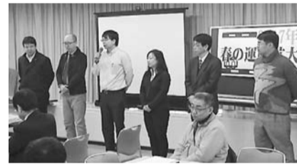
新事務局員6人を紹介

「拡大リレー」は、1月10日から4月21日まで、第一走者の東山民商から24番目の上京民商までの順番で、京都府下の全ての民商がこの春の運動で、毎日、順番に会員1人か読者1人を最低増やして、次の民商へバトンをつなげていく取り組みです。