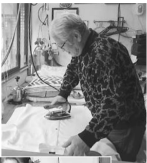
熟練の技が光るアイロンかけ

昔は地域に、クリーニング店がたくさんあり、支部でも同業の役員さん何人かいました。今では自家洗いでなく、大手のクリーニングの取次店が増えています。うちの店では集配を重点において、引越したお得意さんにも頼まれ、市内どこでも取りと配達に行きま