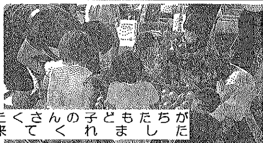
たくさんのお子たちが来てくれました