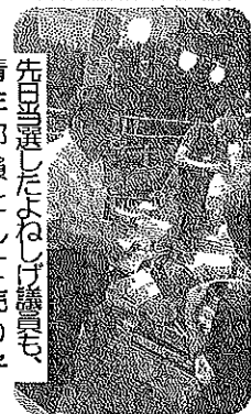
先月選んだお祭り、先月選んだお祭り、先月選んだお祭り