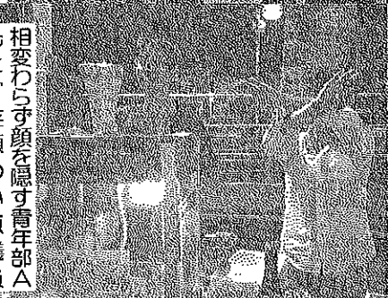
相模原市立小栗山小学校の笑顔が、笑顔のこぼれ、敵なしの子