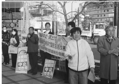
チラシに赤いカーネーションを添えて

生活と健康を守る会、年金者組合、大宅診療所の5団体が集まって、山科区東野公園で3・13重税反対全国統一行動山科地域決起集会を開き、200人が参加しました。