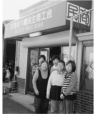
あったか婦人部の仲間たち