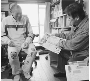
リーフレットで助け合い 共済の魅力を

発行 京都府商工団体連合会 〒615-0042 京都市右京区西院東中水町17 京都府中小企業会館5階 電話 075 (314) 7101 F A X 075 (321) 4416 http://www.kyoshoren.gr.jp/ E-mail : info@kyoshoren.gr.jp